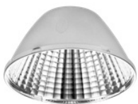
550098000300 LEDSpot3C-C-P R85-Reflector-24D