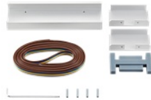
599006008900 LEDLima Connection-Kit