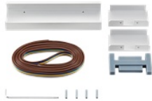
599006008900 LEDLima Connection-Kit