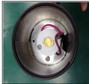
Figure3 Remove the reflector