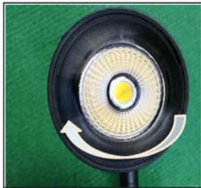
Figure2 Remove the front cover