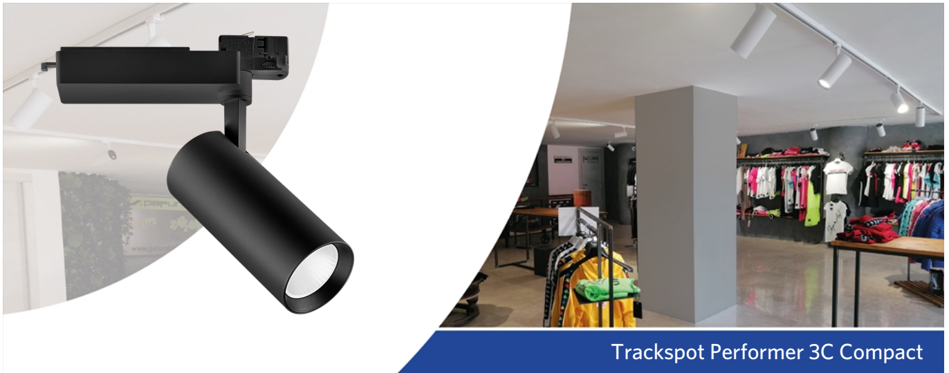
Trackspot Performer 3C Compact