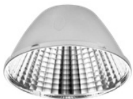
550098000300 LEDSpot3C-C-P R85-Reflector-24D