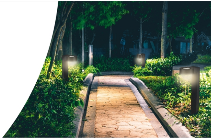
Tuin-/voetpadverlichting Bollard Luke