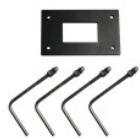
703098000300 LEDBollard-Luke-E Concrete-Mounting-Kit