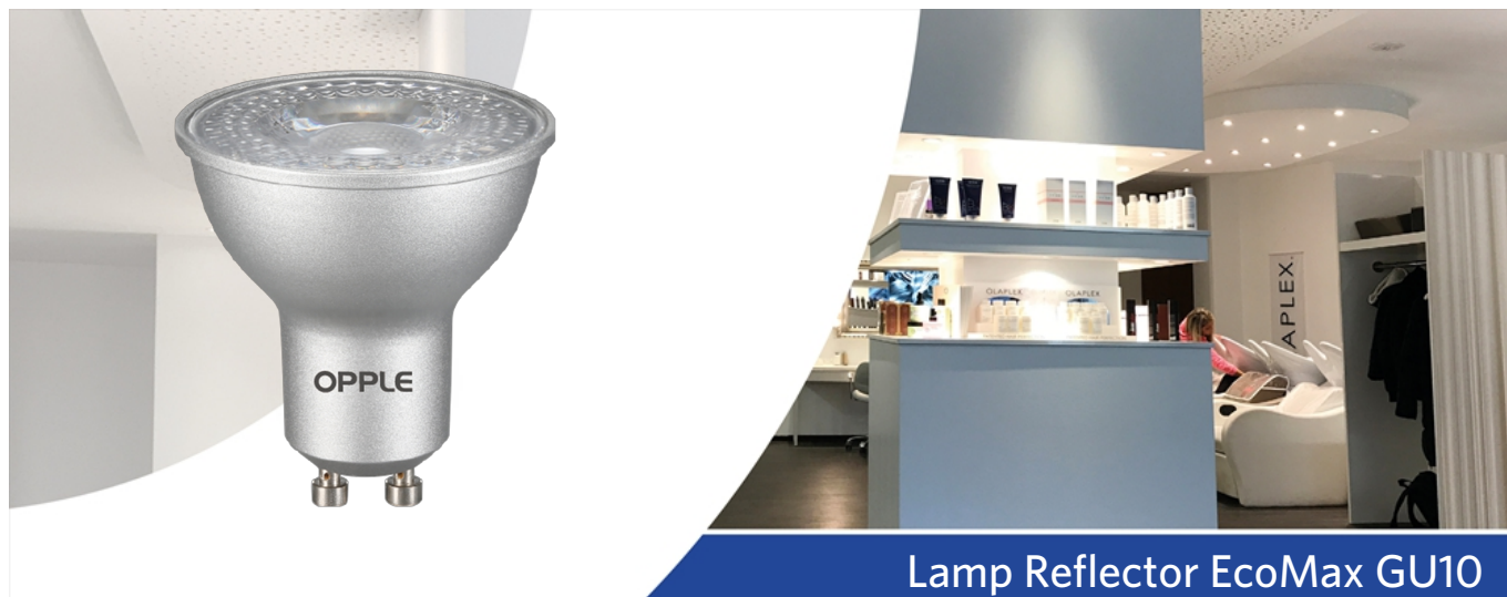
Lamp Reflector EcoMax GU10