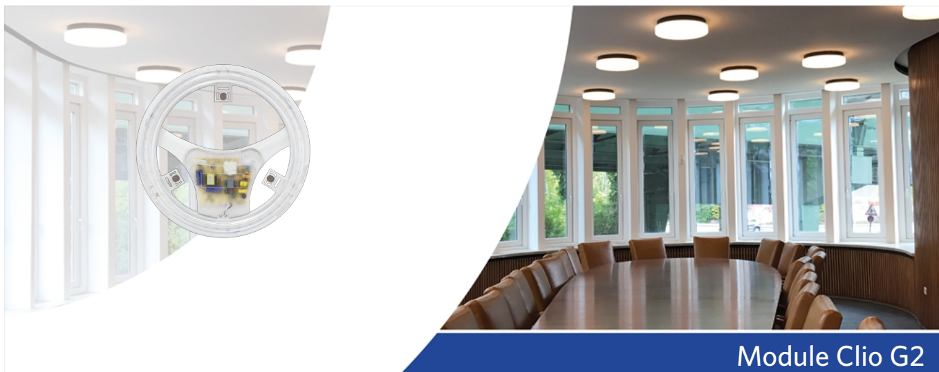
Module Clio G2