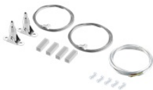
599006009000 LEDLima Suspension-Kit