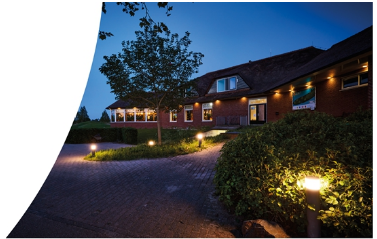
Tuin-/voetpadverlichting Bollard Performer