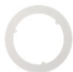
140060646 LEDDownlightRc-P-HZ- Adapter-150-175