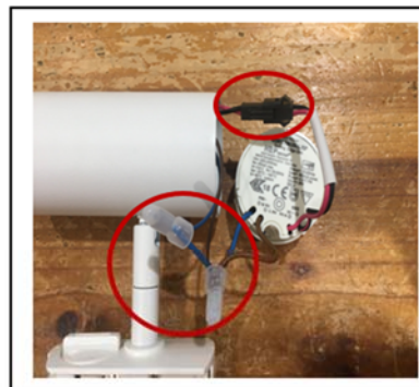
Figure2 Loose the connection