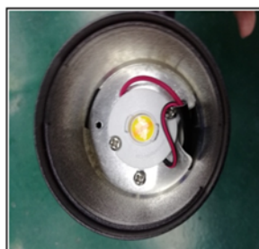
Figure3 Remove the reflector