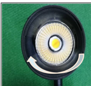
Figure2 Remove the front cover